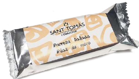
Barreta de blat de moro