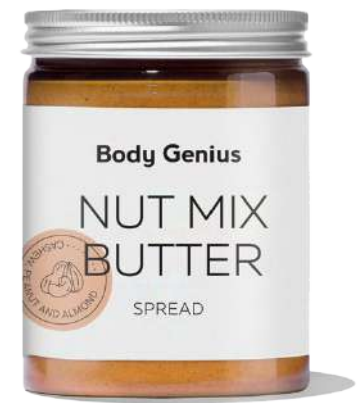
Crema mix d'anacard, cacauet i ametlla 270 g