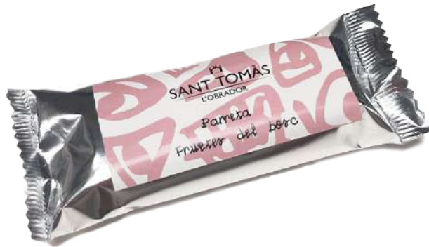
Barreta de fruites del bosc