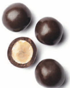
Avellana i xocolata negra