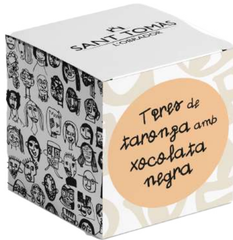
Caixa de cartró 65 g