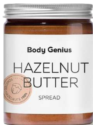
Crema d'avellana 270 g