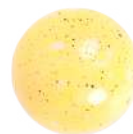
Fruita de la passió