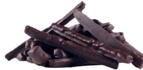
Tires de taronja amb xocolata negra