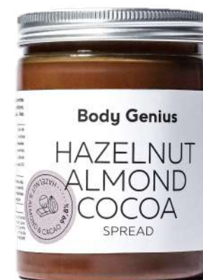
Crema d'avellana suavitzada amb ametlles blanques - 270 g