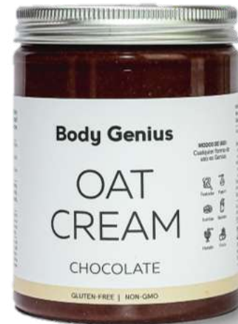
Crema de civada i xocolata - 270 g