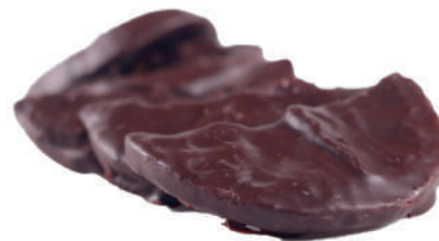
Mitges llunes de taronja amb xocolata negra