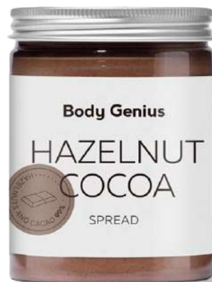
Crema d'avellana i cacau - 270 g