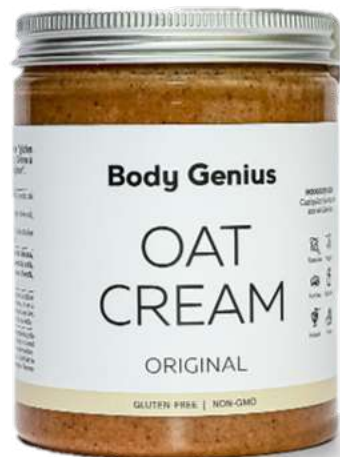
Crema de civada 270 g