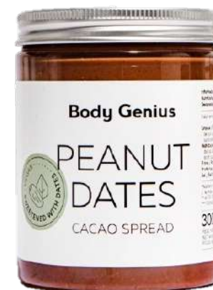
Crema de cacauet cacau i dàtil - 300 g