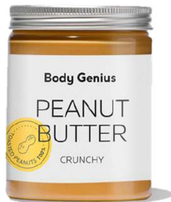
Crema de cacauet cruixent - 270 g