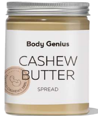
Crema d'anacard 270 g