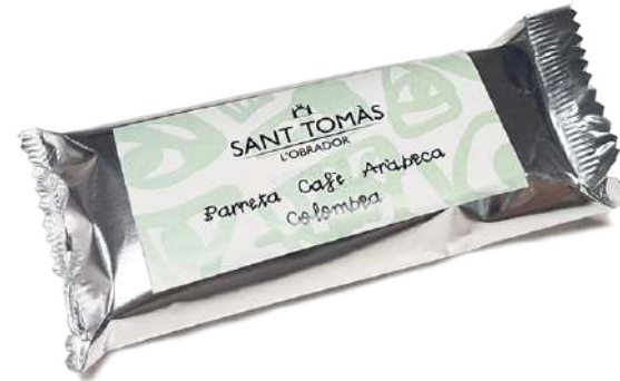
Barreta de cafè