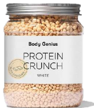
Boletes cruixents de proteïna de soja i llet amb xocolata blanca - 500 g