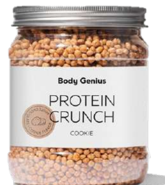
Boletes cruixents de proteïna de soja i llet amb xocolata blanca. Gust de galeta - 500 g