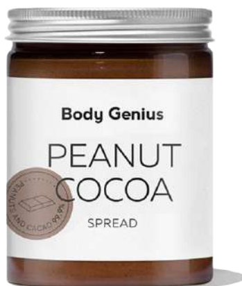
Crema de cacauet i cacau - 300 g