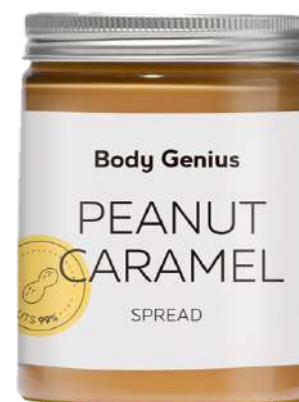
Crema de cacauet i caramel salat - 270 g