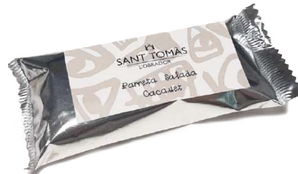
Barreta salada de cacauet