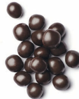
Temptació de taronja i xocolata negra