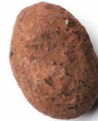
Còdol del Ter (Ametlla dolça amb xocolata blanca i cacau)