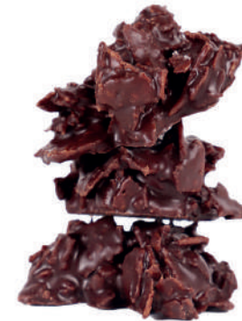
Tomassets (Rocs de patates fregides, xocolata negra i sal)