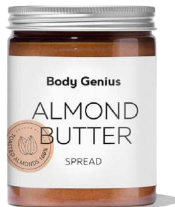
Crema d'ametlla 270 g