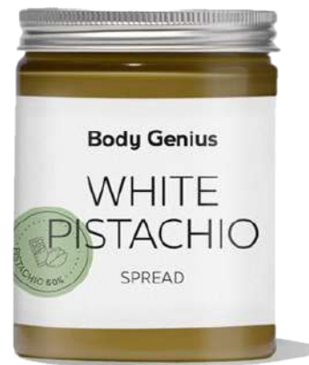
Crema de festuc blanc 270 g