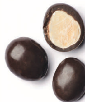
Ametlla i xocolata negra