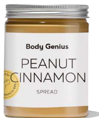
Crema de cacauet i canyella Ceylan - 300 g