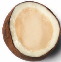
Bombó de Macadàmia