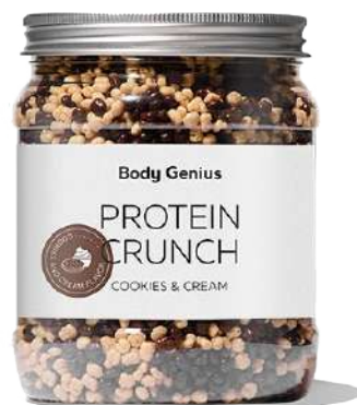
Boletes cruixents de proteïna de soja i llet amb xocolata blanca i xocolata negra - 500 g