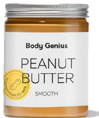
Crema de cacauet cremosa - 300 g