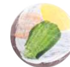
Praliné i cítrics