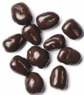
Blat de moro cruixent i xocolata negra