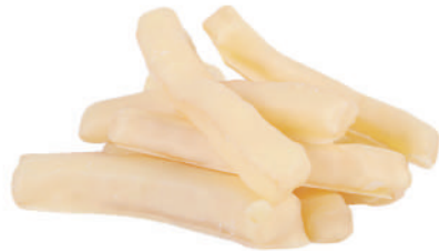
Tires de llimona amb xocolata blanca