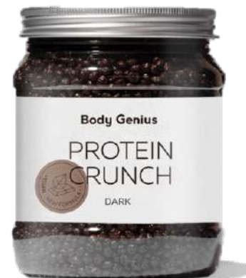
Boletes cruixents de proteïna de soja i pèsol amb xocolata negra - 500 g