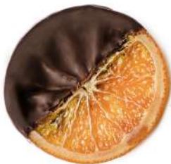
Rodanxa de taronja amb xocolata negra