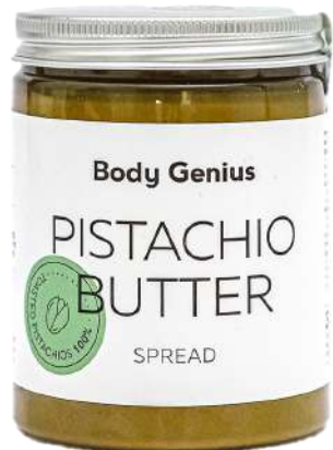
Crema de festuc 270 g