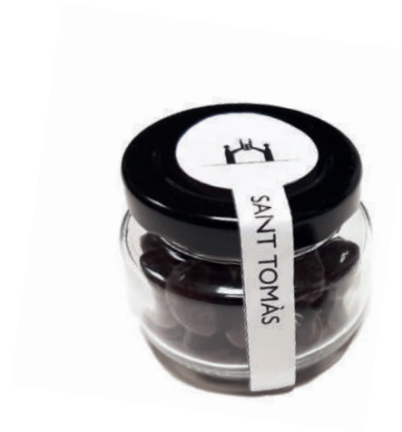
Pot de vidre 35 g