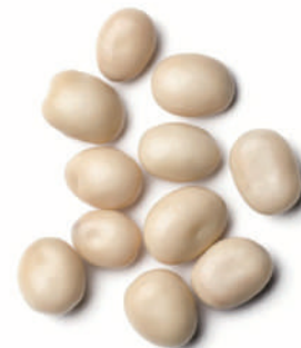
Blat de moro cruixent i xocolata blanca