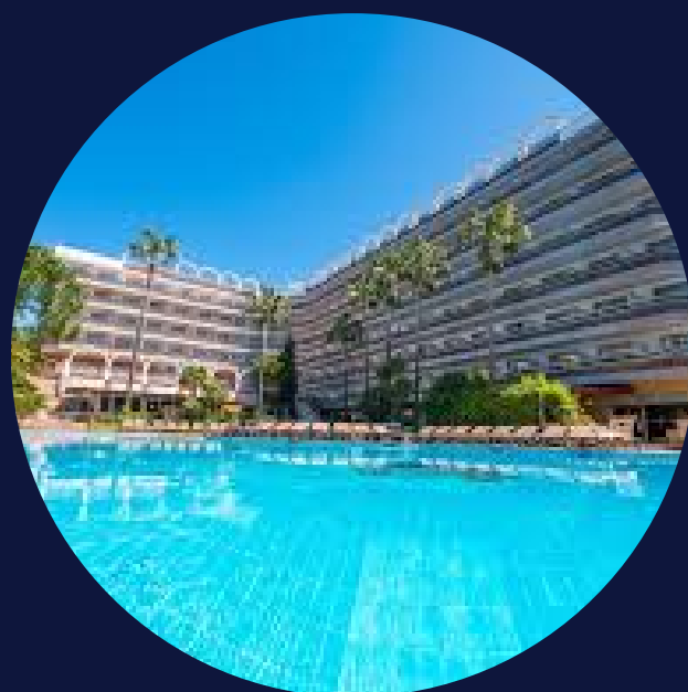
GOLDEN PORT SALOU & SPA

Accés a finançament preferencial i certificacions de sostenibilitat