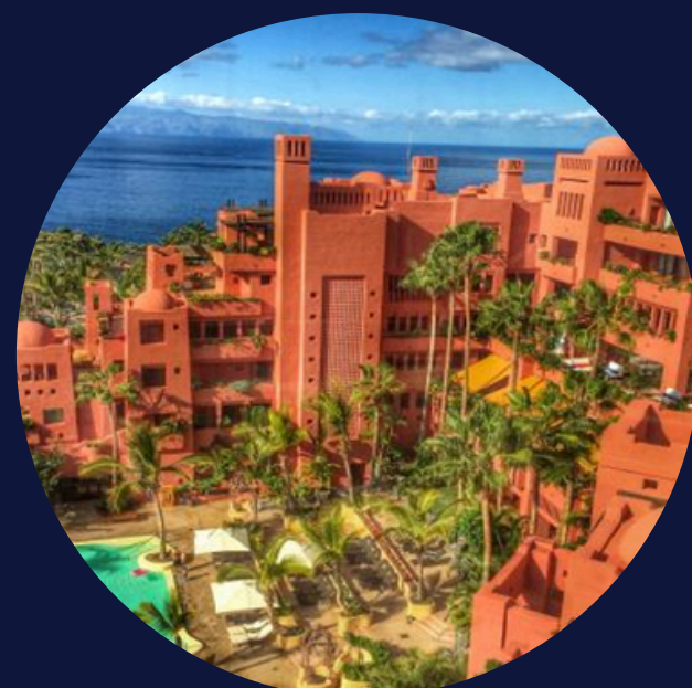
HOTEL RITZ-CARLTON ABAMA

Auditoria Energètica i Implementació d'accions: Electricitat: 5.549.862 kWh/any Gas: 673.592 m 3 /any Estalvis mitjos: 28%