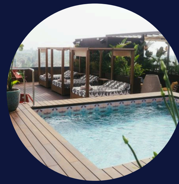
NOBU HOTEL BARCELONA

Sol·licitud de subvenció del 50% per al desenvolupament de projectes per reduir el consum d'aigua Realització d'auditoria hídrica