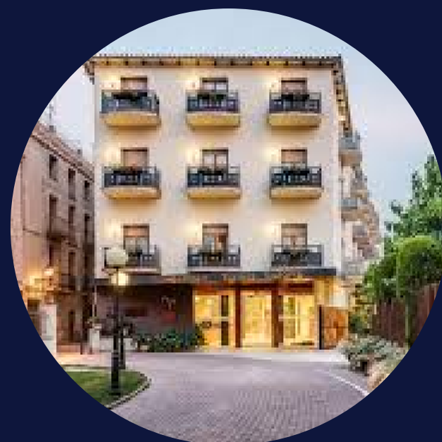
BALNEARI TERMES VICTÒRIA

Projecte de Descarbonització: 48% estalvi energètic Millora de dues lletres al Certificat Energètic Finançament amb subvenció a fons perdut del 50% de la inversió Finançament amb venda de CAE's del 20% de la inversió Financió preferent