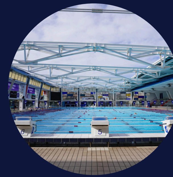
CLUB NATACIÓ TERRASSA

Projecte de Càlcul de Petjada de Carboni de l'organització i pla de mitigació de GEI, segons subvenció CUPON GREEN Manufactura components elèctrics