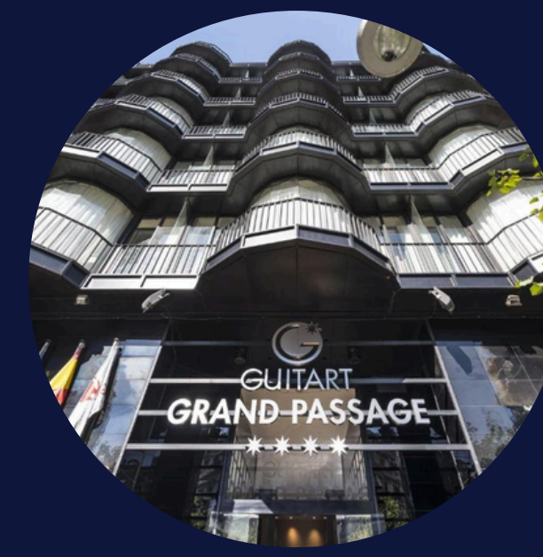
GRUP HOTELS GUITART

Sol·licitud de subvenció del 50% per al desenvolupament de projectes per reduir el consum d'aigua Realització d'auditoria hídrica