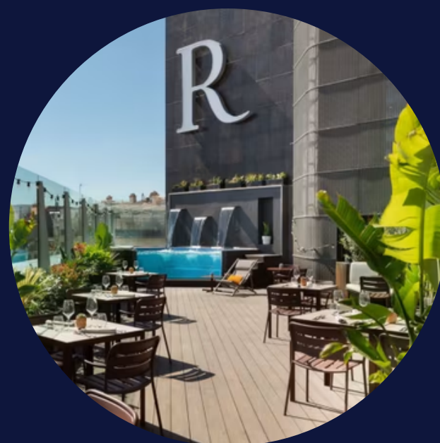
HOTEL RENAIXEMENT BARCELONA

Projecte de Descarbonització: 35% estalvi energètic Millora de dues lletres al Certificat Energètic Finançament amb subvenció a fons perdut del 50% de la inversió Finançament amb venda de CAE's del 20% de la inversió