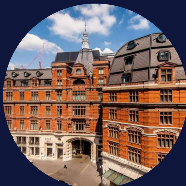
ANDAZ LONDON LIVERPOOL STREET: UN CONCEPTE DE HYATT

Accés a finançament preferencial i certificacions de sostenibilitat